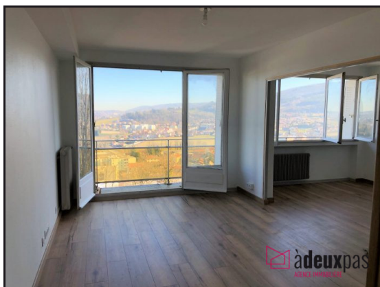
pièce à vivre accès balcon